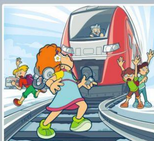
Плеер и железная дорога — несовместимы!