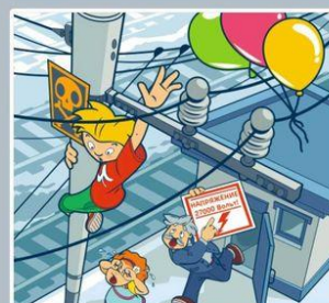
Приближаться к проводам меньше чем на 2 метра — смертельно опасно!