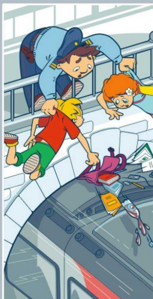
Проезд на крышах и подножках поездов — может стоить жизни!