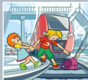
Нельзя переходить пути в неполюженном месте!