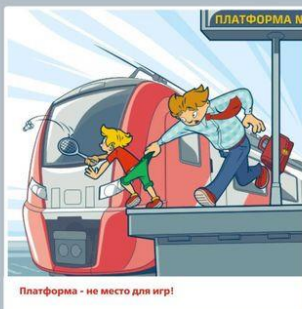
Платформа — не место для игр!